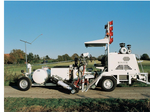
farba / ekstruder do mas termoplastycznych