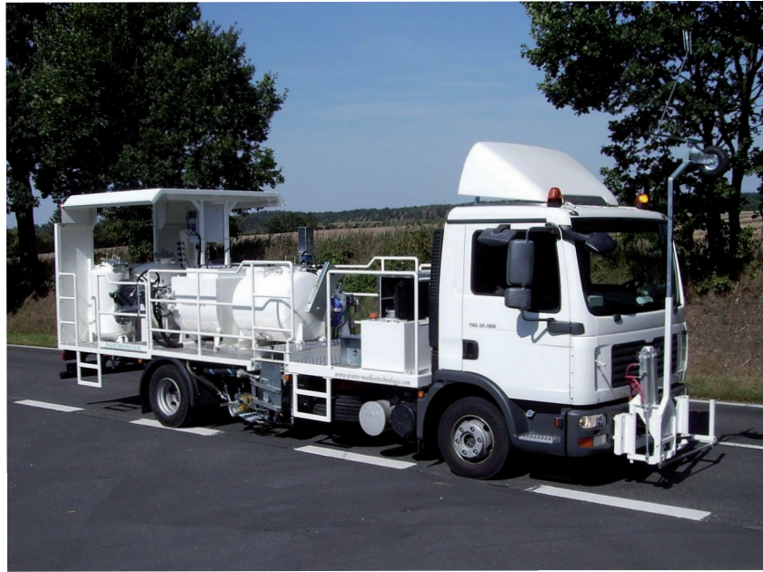
masy chemoutwardzalne / kropki / linie

malowarki samojezdne do znakowania na dłuższych dystansach