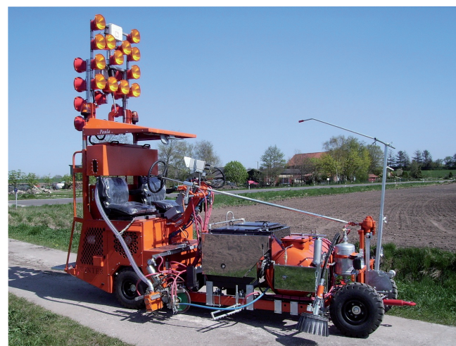
masy termoplastyczne / farba